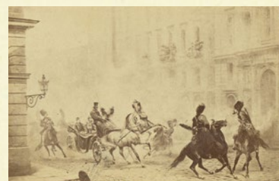
Maksymilian Fajans, Zamach na namiestnika Fiodora Berga

Oto — patrz, Fryderyku! To Warszawa: Pod rozpłomienioną gwiazdą Dziwnie jaskrawa — — — Patrz, organy u Fary; patrz! Twoje gniazdo: Owdzie patrycjalne domy stare Jak Pospolita-rzecz , Bruki placów głuche i szare I Zyguntowy w chmurze miecz.