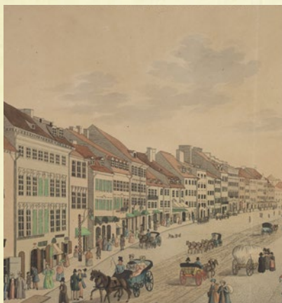
Krakowskie Przedmieście w Warszawie, 1834 r.

* J.W. Gomulicki, Nauczyciel Norwida, „Myśl Narodowa” 1935 r., nr 17