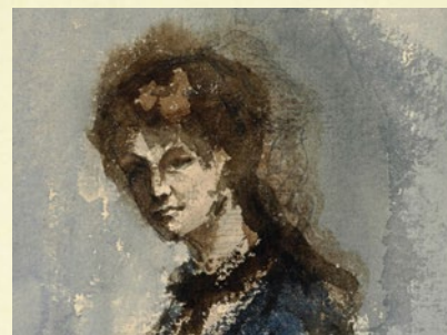
Cyprian K. Norwid, Studium portretowe młodej kobiety, Polona

Tablica na gmachu przypomina, że w gimnazjum rozwijał konspiracyjną działalność student Kursów Prawnych Karol Levittoux. Norwid, który go znał i sam uczęszczał na tajne spotkania patriotycznie nastawionej młodzieży, głęboko przeżył jego aresztowanie w 1841 roku. Levittoux obawiając się, że podczas brutalnego śledztwa mógłby wydać swoich towarzyszy, popełnił samobójstwo w warszawskiej cytadeli. Norwid opisał szczegóły tego wstrząsającego wydarzenia w liście do Zygmunta Krasieńskiego. Pamięci spiskowca poświęcił swój wiersz Burza . Utwór ten stał się poetycką repliką na odsłonięcie przez carskie władze obelisku ku czci wojskowych, którzy podczas nocy listopadowej pozostali wierni carowi Mikołajowi. Wiersz ze względu na swoją wymowę nie mógł zostać opublikowany w cenzurowanej prasie warszawskiej.