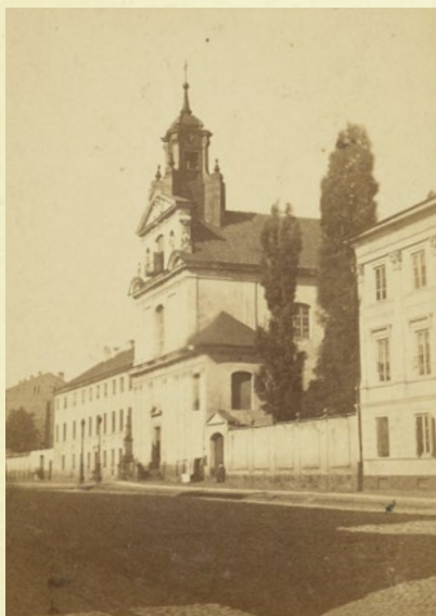
Kościół Narodzenia NMP przy dawnej ulicy Leszno w Warszawie