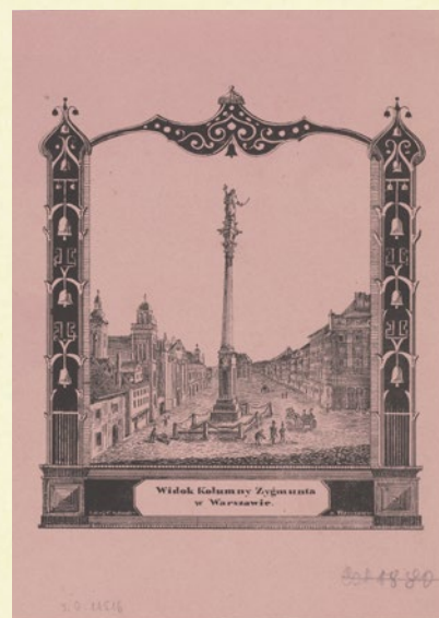
Widok Kolumny Zygmunta w Warszawie, 1832-1843

W Warszawie młody Norwid kształcił się, rozwijał swój talent malarski. Tutaj powstały i zostały opublikowane jego pierwsze utwory literackie. Początkujący poeta brał aktywny udział w życiu kulturalnym miasta. Na warszawskich salonach poznał smak sławy, ale także mierzył się z krytyką swoich dokonań. W maju 1842 roku udał się w podróż zagraniczną i nigdy już do kraju nie powrócił, jednak Warszawa — miasto młodości poety — pozostała nadal obecna w jego utworach.