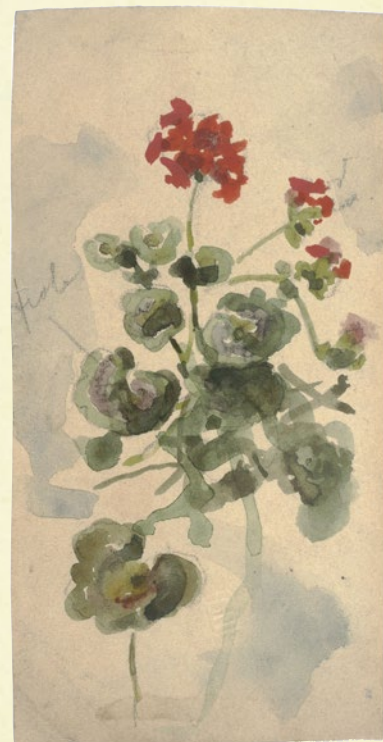
Cyprian K. Norwid, Pelargonie, Polona