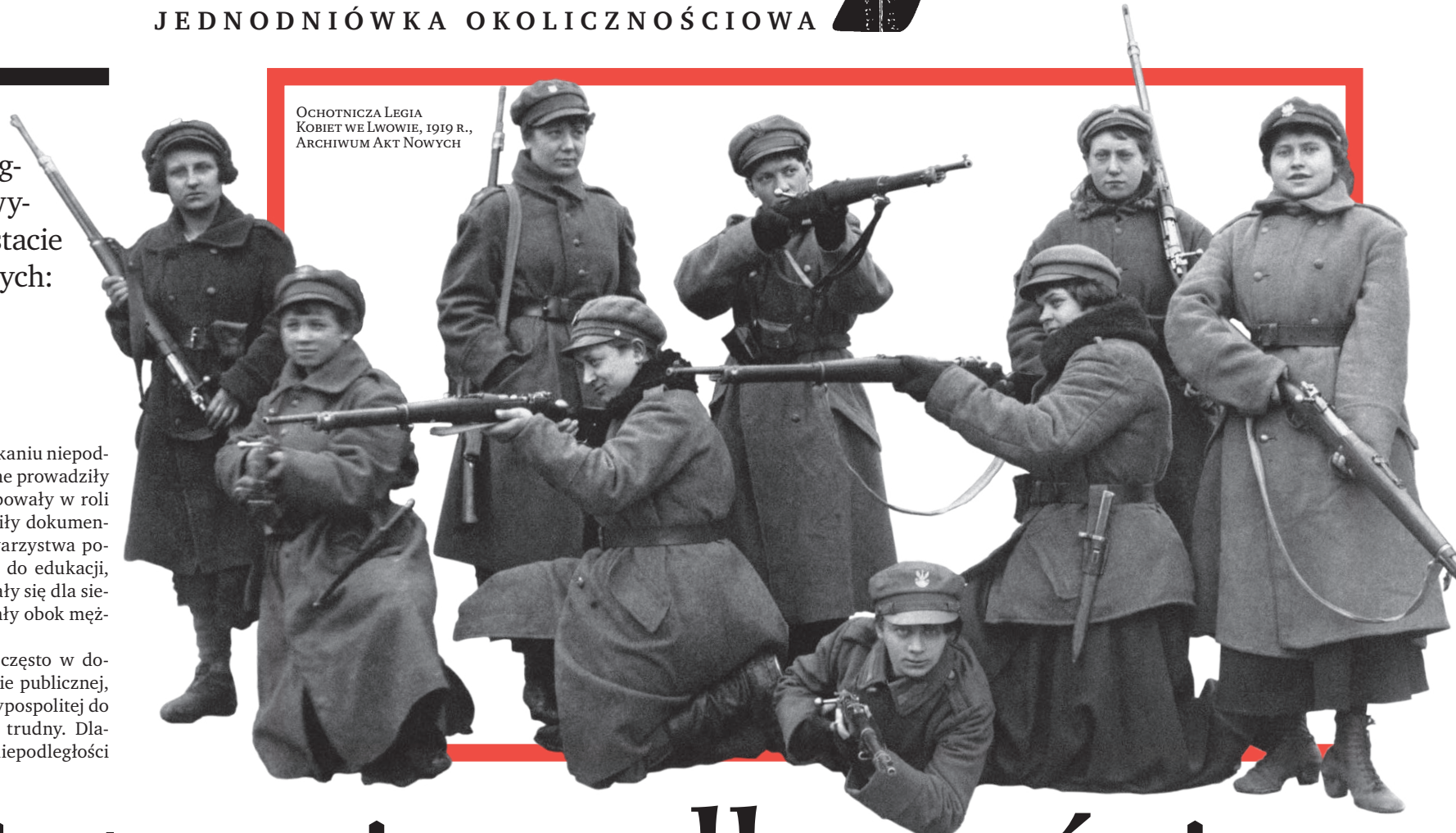
OCHOTNICZA LEGIA Kobiet we Lwowie, 1919 r.

Bez ich działań, prowadzonych często w domowym zaciszu, ale także na arenie publicznej, w miastach i wsiach, powrót Rzeczypospolitej do grona państw suwerennych byłby trudny. Dlatego w 100. rocznicę odzyskania niepodległości