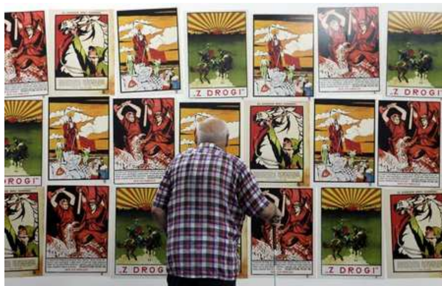
Bitewne plakaty w namiocie przed Pałacem Kultury i Nauki w Warszawie